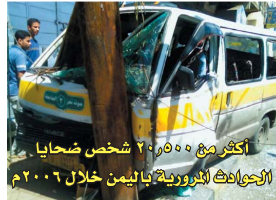
أكثر من ٢٠٠,٥٠٠ شخص ضحايا الحوادث الكروية باليمن خلال ٢٠٠٦م

أظهرت دراسة أعدتها شركة "كولومبوس" للتأمين في ولاية أوهايو الأمريكية، وشملت ١٢٠٠ سائق أميركي، أن ٨٠ في المائة من حوادث الطرق في الولايات المتحدة سببها شروذ الذهن. وأشارت الدراسة أن ٧٣ في المائة من هؤلاء اعترفوا باستخدام الهاتف النقال (السيار) أثناء القيادة على رغم معرفتهم بأنهم يخالفون بذلك القوانين. واعترف ١٦ في المائة منهم بقيادتهم سياراتهم وفقاً للقوانين في مقابل ٣٨ في المائة قالوا إنهم يقودون من دون تفكير أو حتى من دون النظر إلى عداد